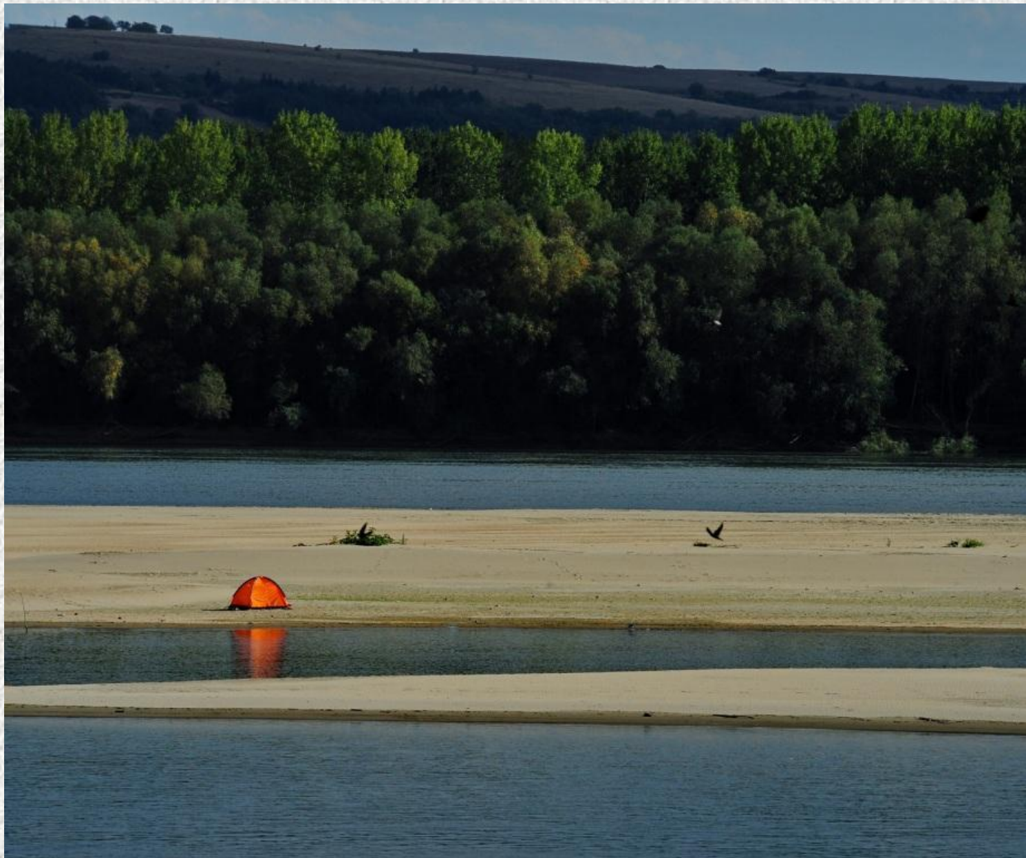
Situl VEDEA – DUNĂRE