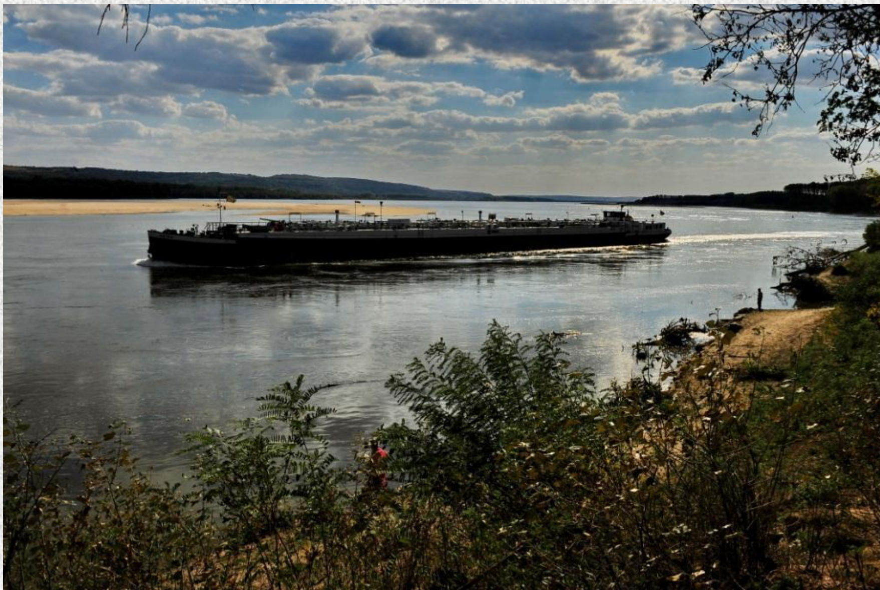
Situl VEDEA – DUNĂRE