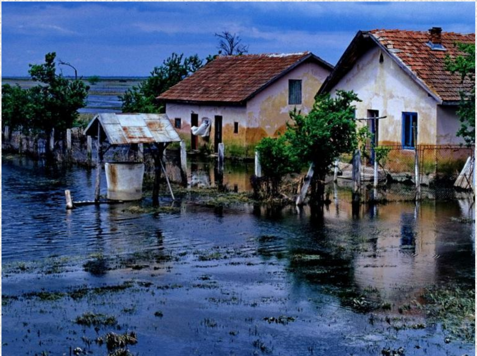
Inundațiile din 2006 - situ CONFLUENȚA JIU – DUNĂRE