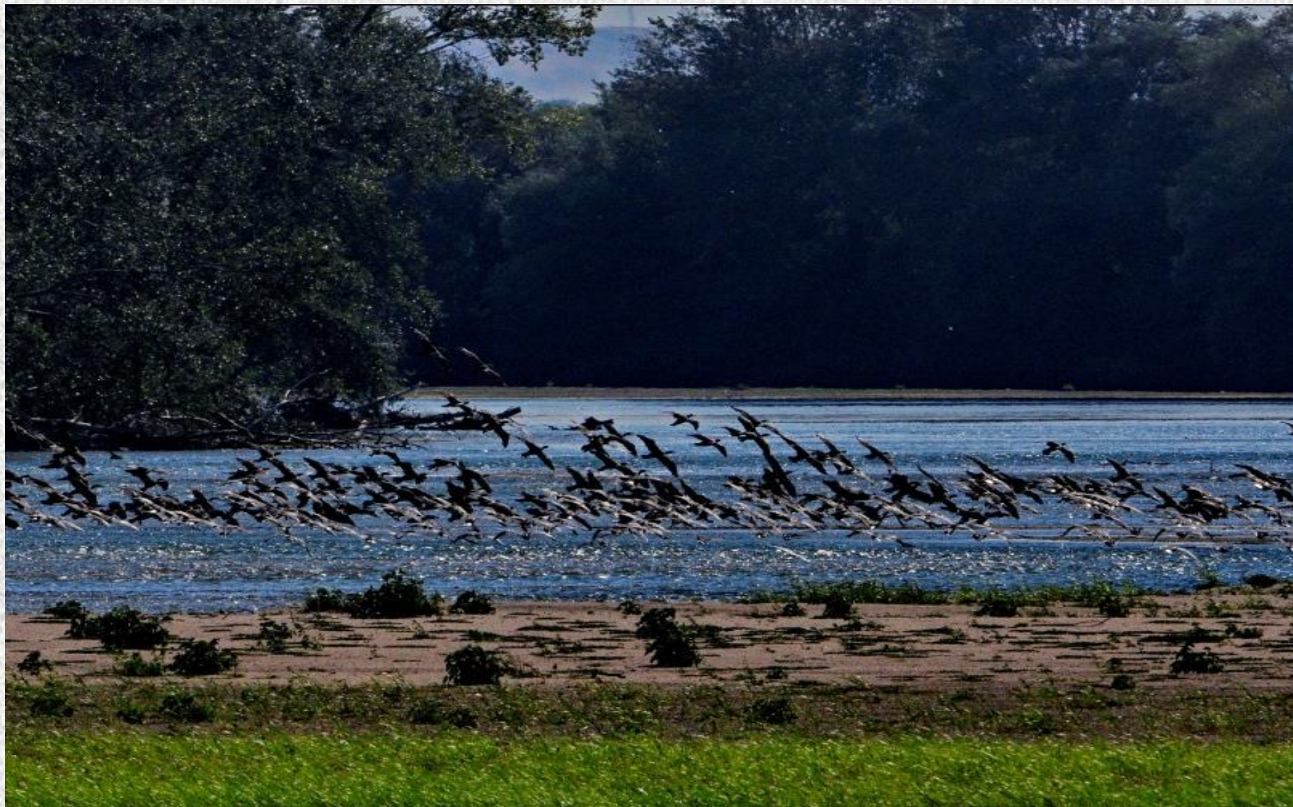
Cormorani mari - situl CONFLUENȚA JIU – DUNĂRE