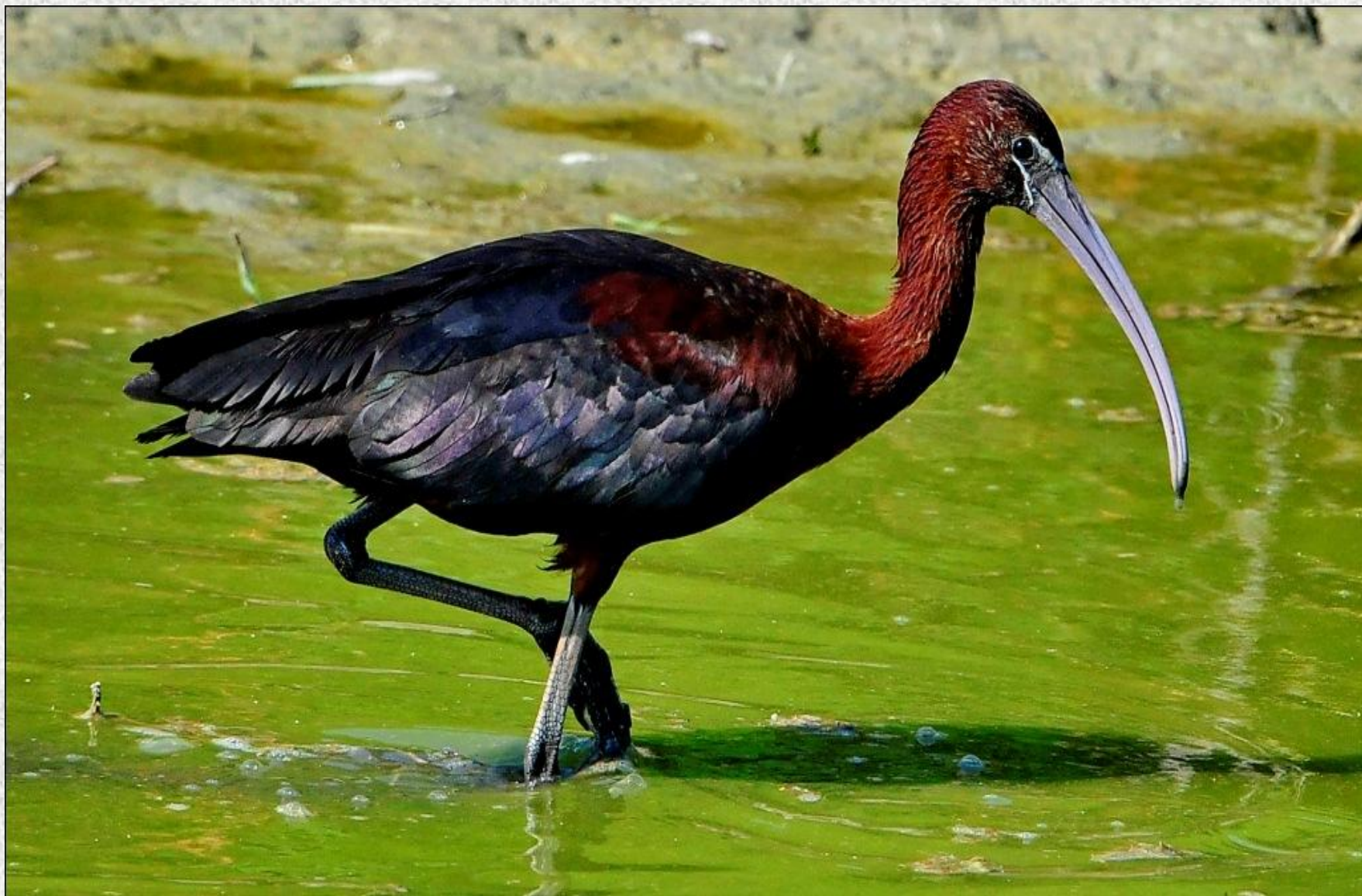
Țigănuș - situl CIOCĂNEȘTI - DUNĂRE