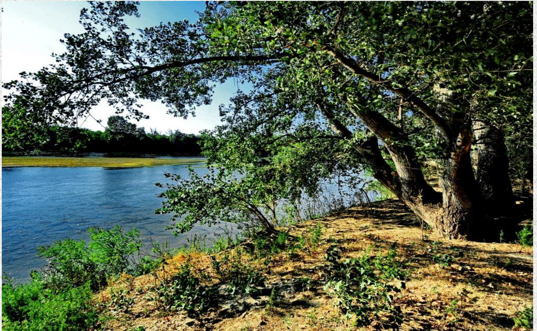
Situl CONFLUENȚA JIU – DUNĂRE