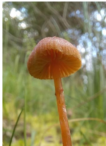
Galerina paludosa Clopoțelul de mușchi