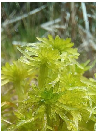
Sphagnum Mușchi de turbă