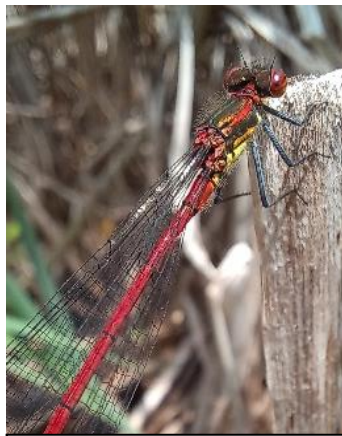
Pyrrhosoma nymphula Libelula roșie