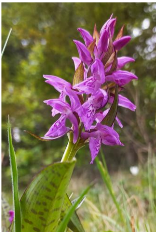
Dactylorhiza cordigera Orhideea inimii