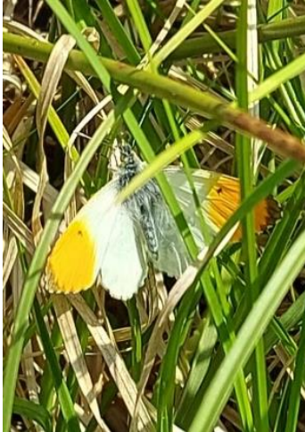
Anthocharis cardamines Aurora de primăvară