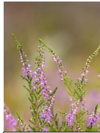
Calluna vulgaris Iarba neagră