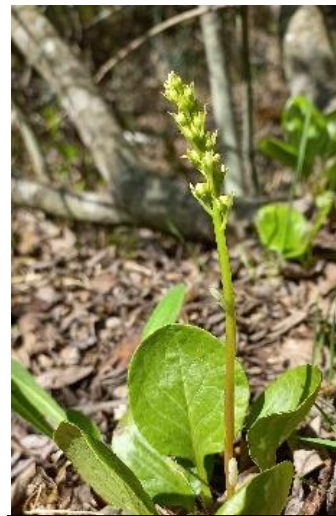
Pyrola rotundifolia Perișor

Imaginile din text au fost prelucrate cu softul LunaPic