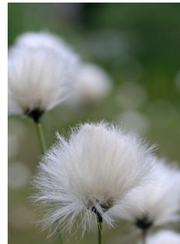
Eriophorum vaginatum Bumbăcărița

Working together for a green , competitive and inclusive Europe