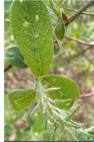
Salix caprea Salcie caprească